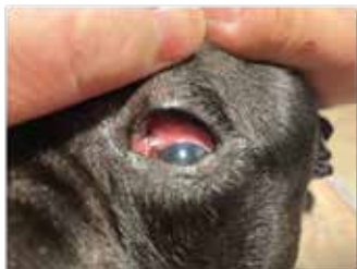
GOLIATH - 10 ANS - CONJONCTIVITE FLUORESCÉINE négative