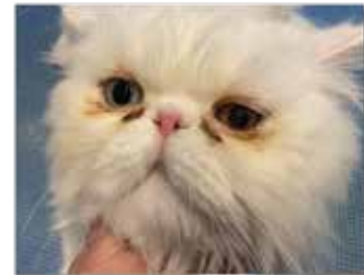
COQUIN - PERSAN - ÉCOULEMENT MARRON